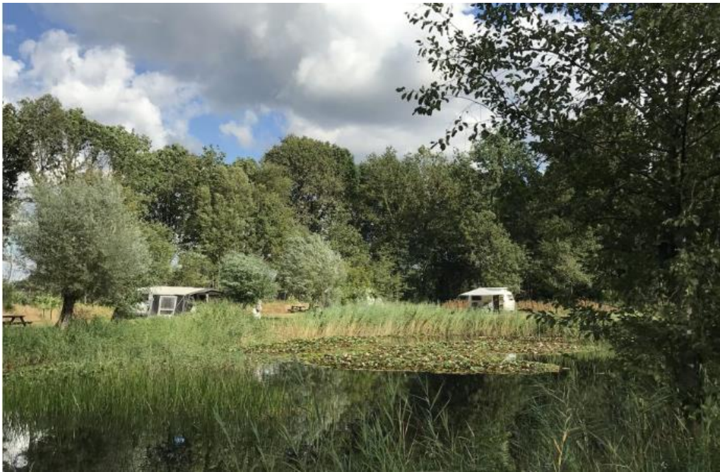
Nivon natuurcamping De Meenthe

Er is ook nog een langere tweedaagse van station Heerenveen naar station Steenwijk.