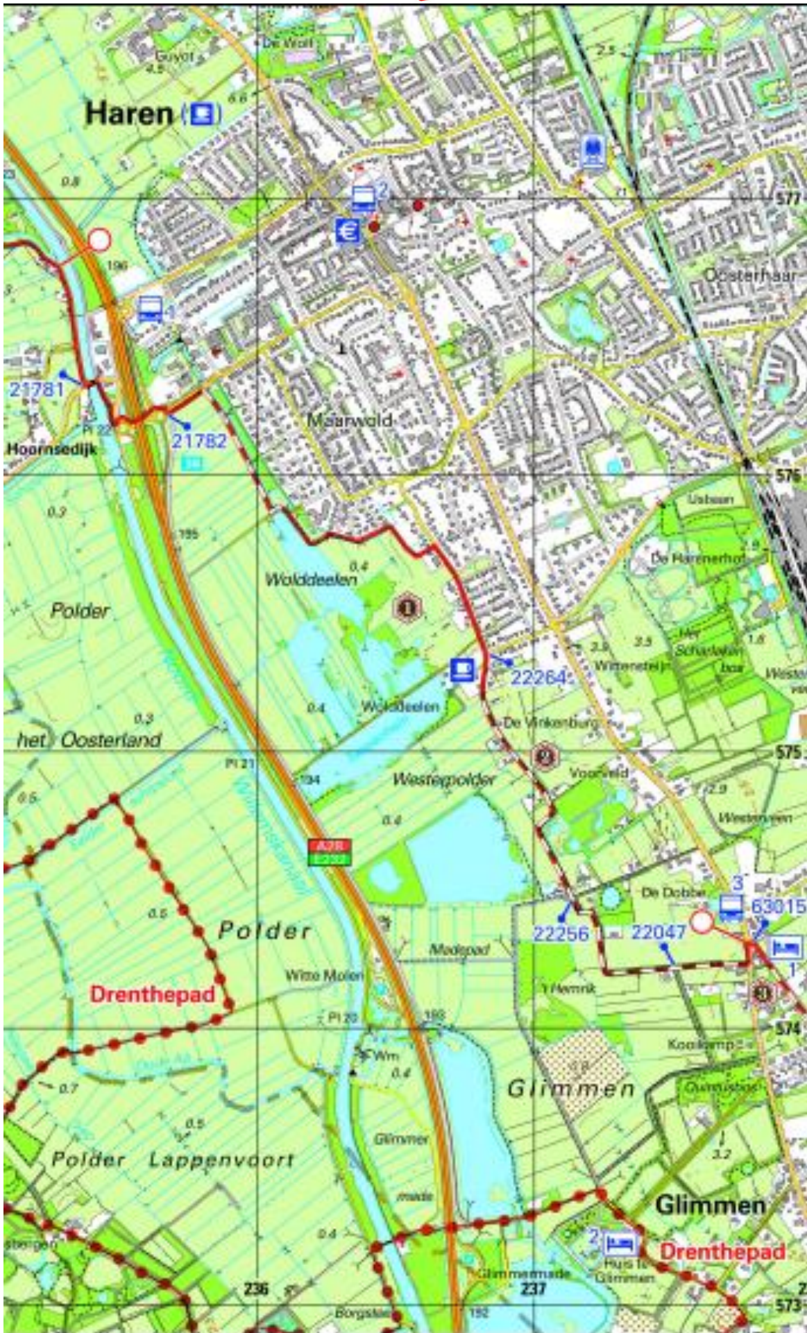
Pieterpad kaart 9