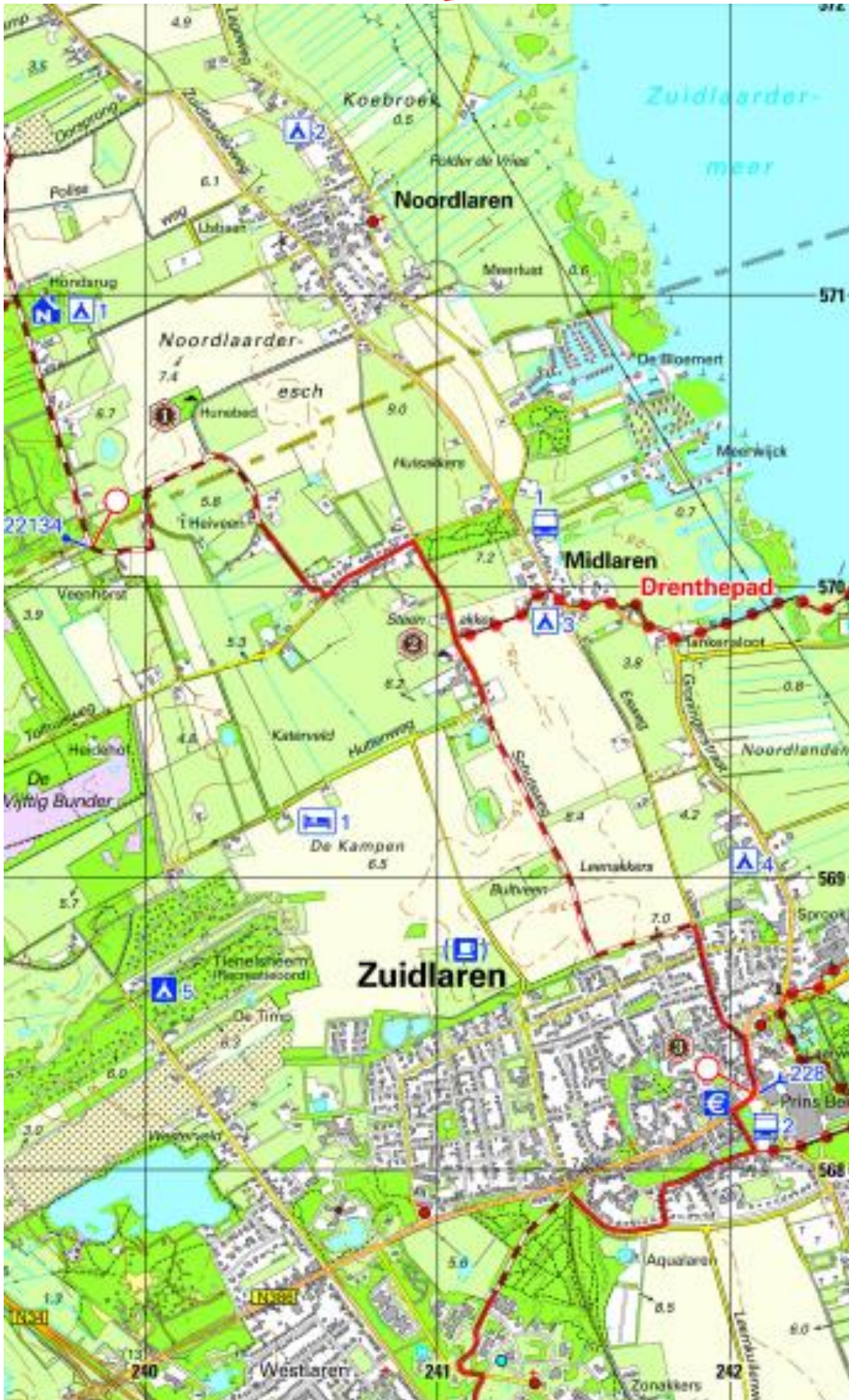
Pieterpad kaart 11