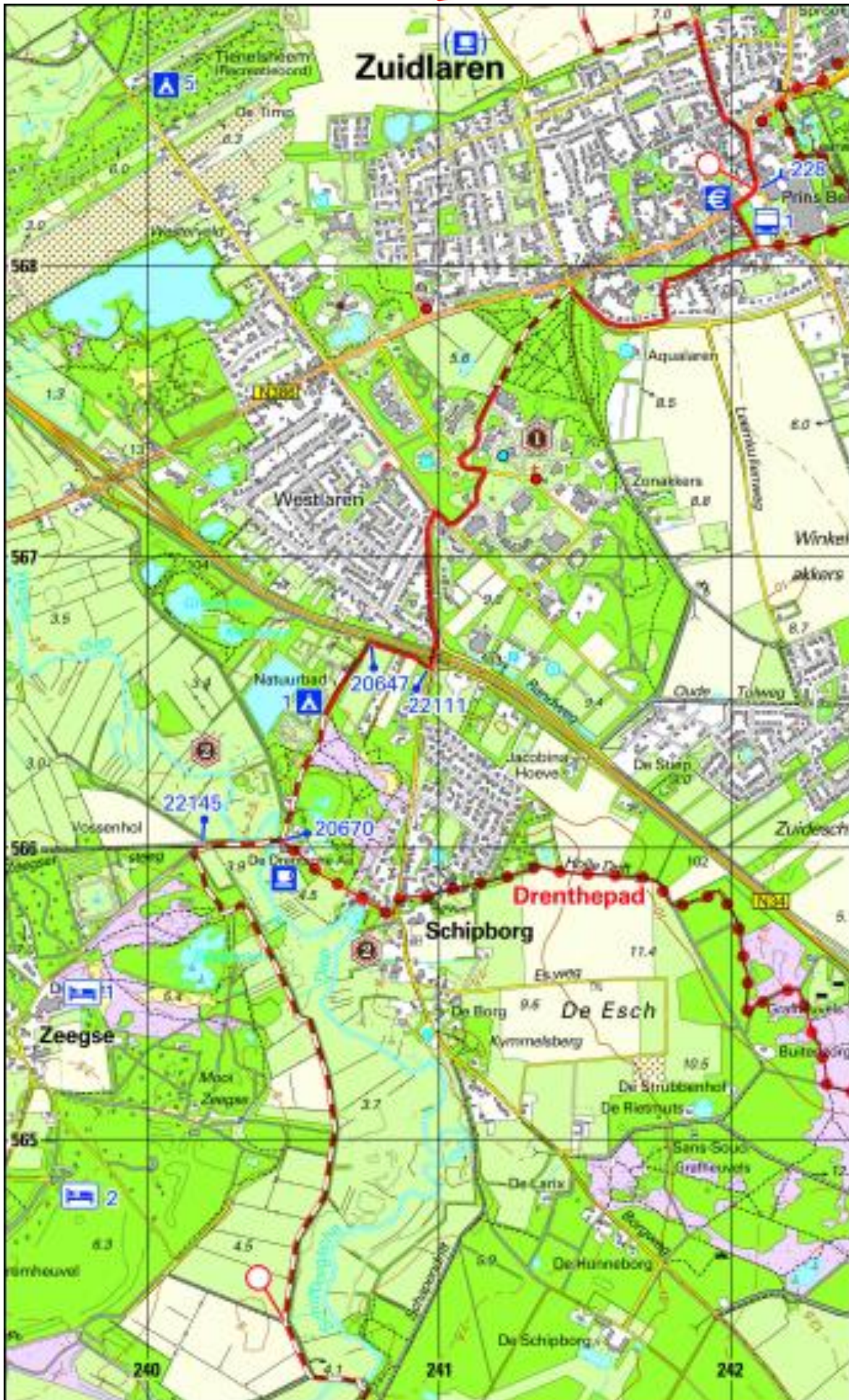
Pieterpad kaart 12