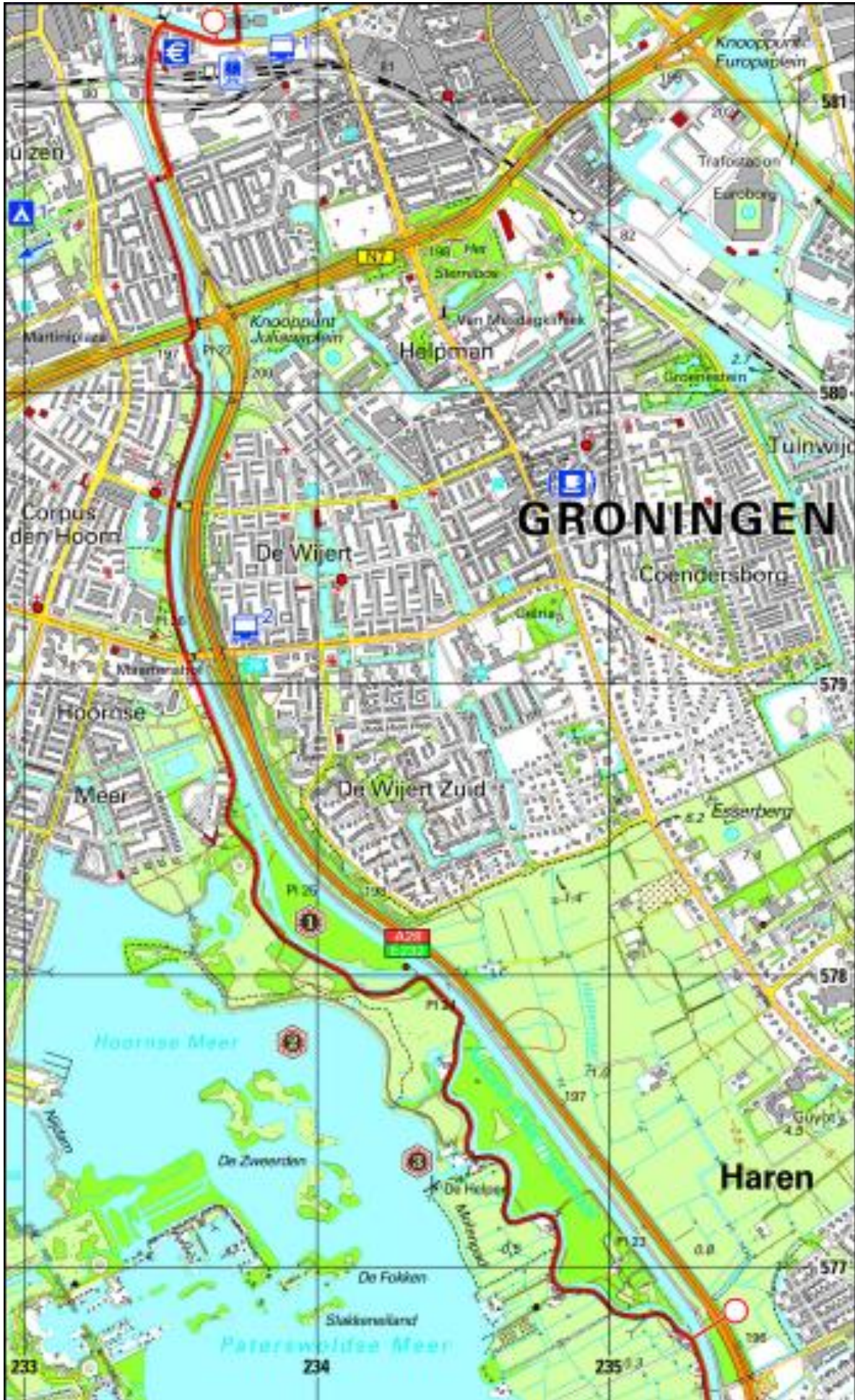
Pieterpad kaart 8