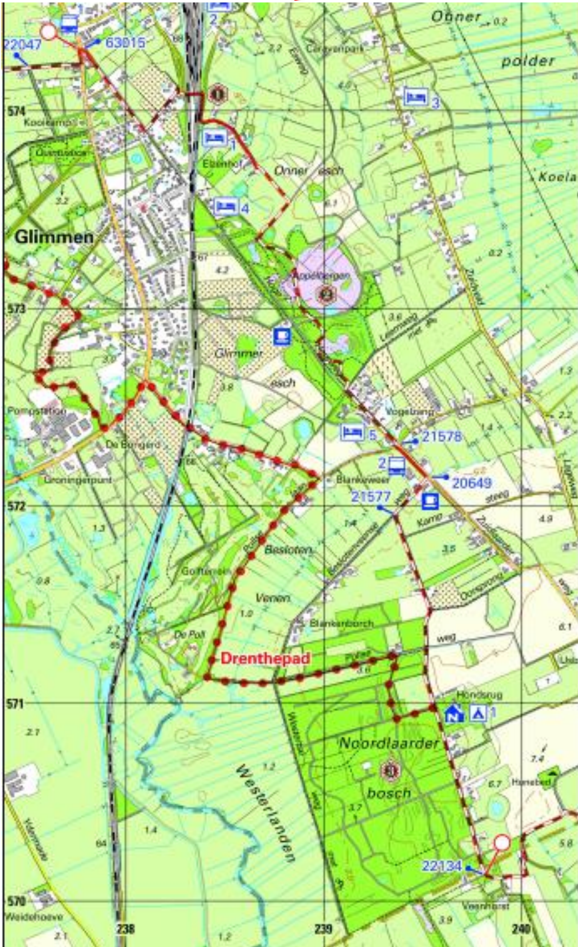
Pieterpad kaart 10