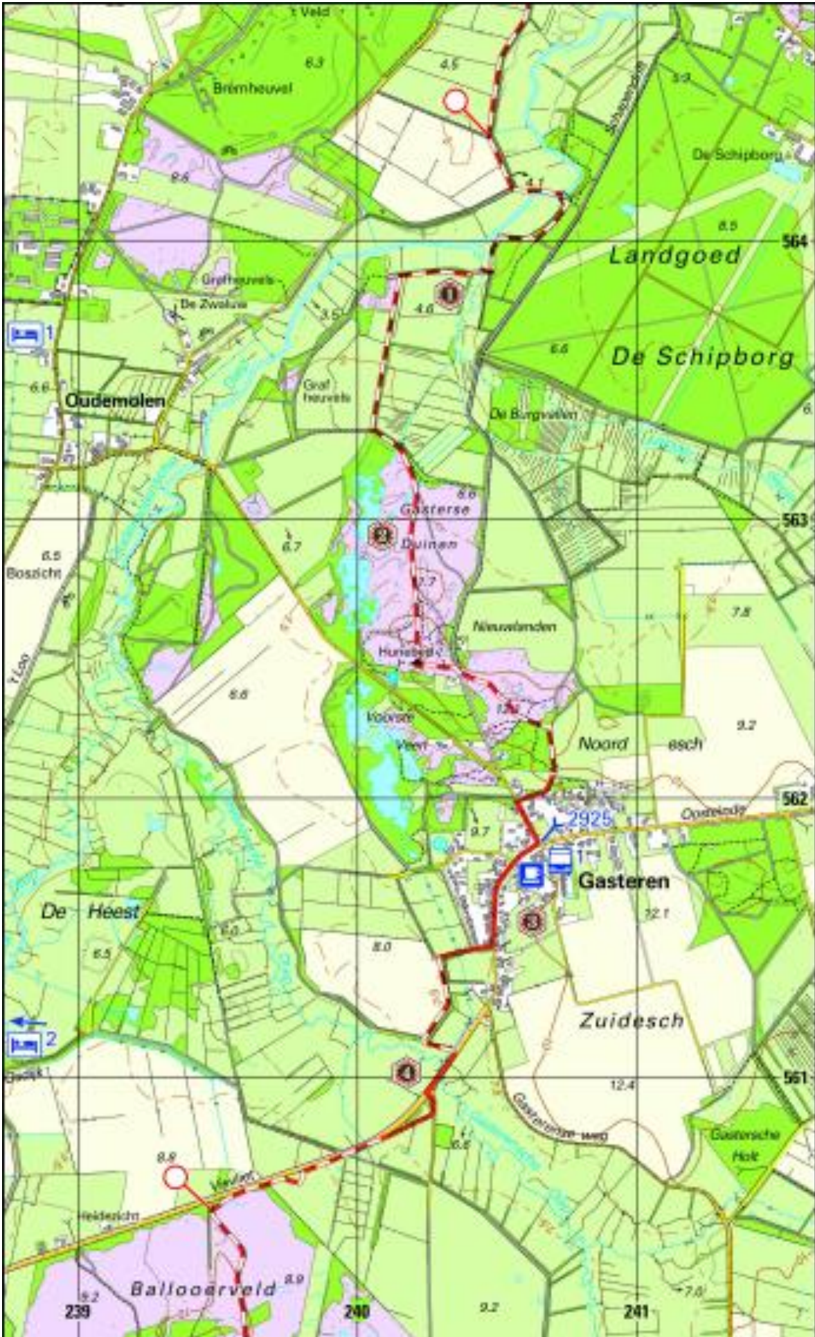
Pieterpad kaart 13