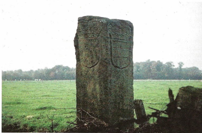
Grenssteen 1, nu Gp 832.

"Precies 250 jaar werd in Klooster Burlo een verdrag gesloten tussen bisdom Münster en hertogdom Gelre, het Verdrag van Burlo. In 1766 werden